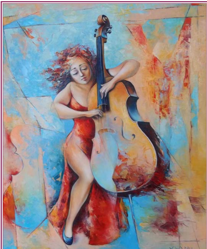
Մնացական ՔԱԼԱՇՅԱՆ. «Անվերնագիր» (ՎՊՄԻ շրջանավարտ)